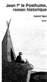
Jean 1 er le Posthume, roman historique Fabrice Vigne THIERRY MAGNIER 144 p., 7 €